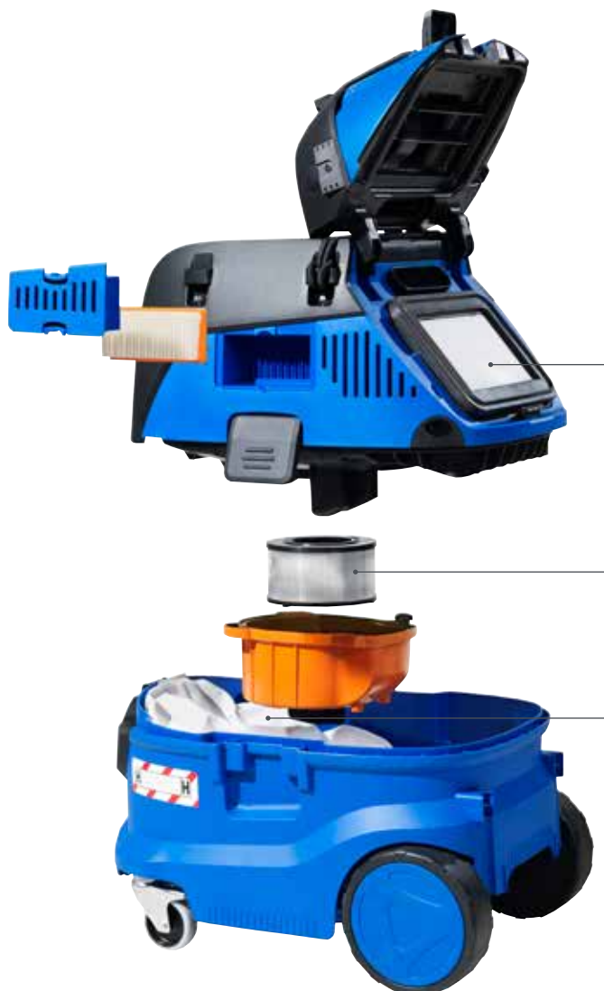
PTFE M-Klasse Hauptfilterelement (99,9 % Abscheidegrad)

Darüber hinaus sind die Staubklasse H-Sauger als Asbestsauger zertifiziert und mit einer einzigartigen, dreistufigen Filtration ausgestattet. Diese setzt sich aus einem Sicherheitsfiltersack, einem PTFE-Flachfaltenfilter und einer HEPA Filterkassette zusammen. Das sorgt für eine lange Lebensdauer und senkt damit deutlich die Betriebskosten.